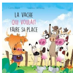
La vache qui voulait faire sa place (de Carine Paquin)

Chers parents, nous vous demandons votre collaboration pour nous aider à sensibiliser les élèves à l'importance du respect de l'autre. Avec les événements difficiles à travers le monde qui sont rapportés aux nouvelles, nous trouvons qu'il est plus important que jamais de sensibiliser les enfants au respect et à la paix. Pour les intéressés, voici quelques suggestions d'albums de littérature jeunesse pour aborder ces sujets importants de façon ludique avec les enfants.