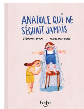
Anatole qui ne séchait jamais (de Stéphanie Boulay)