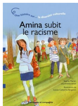
Amina subit le racisme (de Sophie Martel)